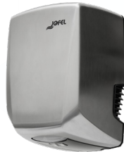
AA57500 8427950367540 Finition INOX satinée