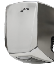
AA57000 8427950367502 Finition INOX brillant