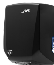
AA56600-MT 8427950367427 Finition noire mate