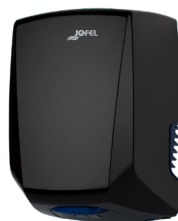
AA56600 8427950367427 Finition noire