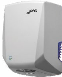
AA56300 8427950367380 Acabado Plata