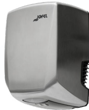
AA57500 8427950367540 Acabado INOX satinado