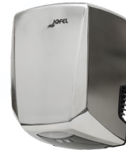
AA57000 8427950367502 Acabado INOX brillo