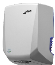
AA56300 8427950367380 Acabado Plata