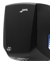
AA56600-MT 8427950367427 Acabado Negro Mate