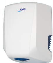
AA56000 8427950367342 Acabado Blanco