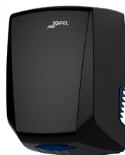
AA56600 8427950367427 Acabado Negro