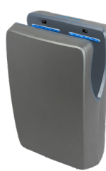
AA24950 8427950360626 Acabado Grafito