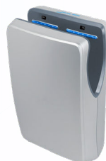
AA24550 8427950360602 Acabado Plateado