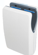
AA24050 8427950360596 Acabado Blanco