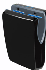
AA24650 8427950360619 Acabado Negro