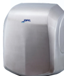
AA18500 8427950340246 Acabado Satinado