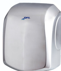
AA18000 8427950340215 Acabado Brillo