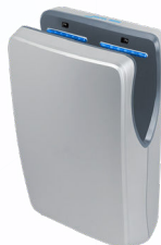
AA24550 8427950360602 Ausführung: Silber