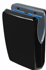
AA24650 8427950360619 Ausführung: Schwarz