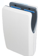
AA24050 8427950360596 Ausführung: Weiß