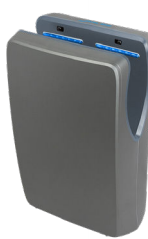
AA24950 8427950360626 Ausführung: Grafit