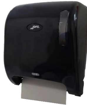
AG65600 8427950388415 Noir