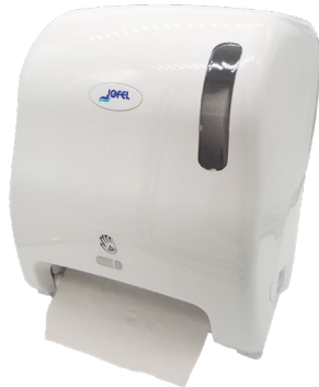
AG65000 8427950382826 Blanc