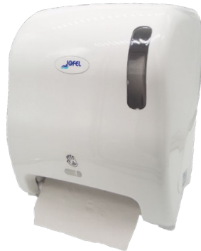
AG65000 8427950382826 Blanco