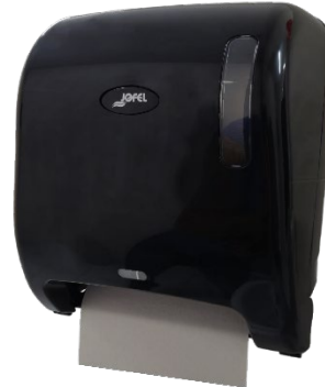
AG65600 8427950388415 Negro